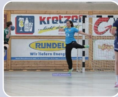
Unterschiedlich große Banner